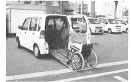
福祉車両貸出事業