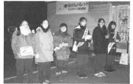
柏陽中学校の皆さまによる街頭募金

今年も12月1日から『歳末たすけあい募金』が始まります。 皆様からの温かいご協力をお願いいたします。