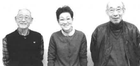
▲アシスタントボランティアの皆さん

今回のボランティアセンター情報では、アシスタントの皆さんの活動の様子をご紹介します。今年度はアシスタントの養成研修も実施予定です！