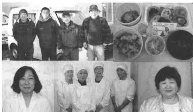
▲調理・配送担当のシルバー人材センターの皆さん

私たちが普段何気なく行っている食事は、美味しいという楽しみや満足感を与えてくれます。恵庭市では昭和60年代から高齢、心身の障がい等により調理が困難な在宅生活者に対して、「高齢者等配食サービス事業」を実施し、栄養バランスのとれた食事の提供と安否の確認を行っています。