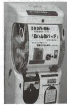
缶バッジガチャガチャ