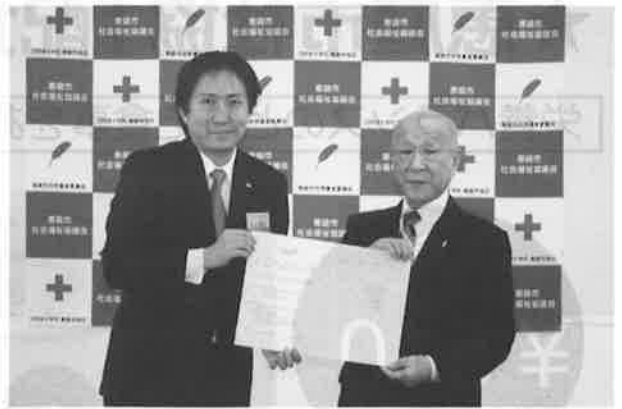
【恵庭青年会議所との協定】

その他、赤い羽根共同募金の配分を受けて発電機やポータブルストーブ等の災害備品を購入し、被災者の生活の支援を行なう災害ボランティアセンターの運営をスムーズに行えるよう日頃から準備を進めています。