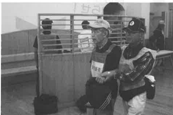
【高齢者への支援活動の様子】

9月2日（水）に恵庭市で総合防災訓練が行われ、本会も災害ボランティアセンター設置・運営訓練に参加しました。