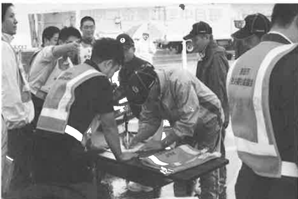
【ボランティア受付の様子】