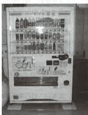
募金機能付自動販売機

いろんな募金の方法が増えています。 募金機能付きの自動販売機を「恵庭道と川の駅」や「島松体育館」など市内7か所に設置しています。 また、北海道共同募金会限定の日ハム缶バッジガチャガチャを福祉会館に設置しております。200円以上の募金で回すことができます。