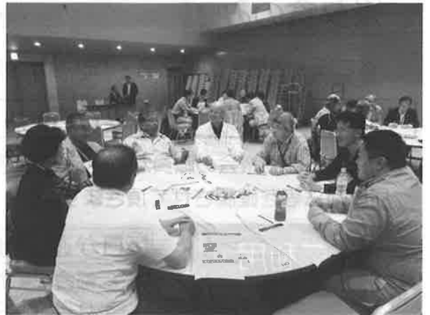
【地域防災フォーラム】