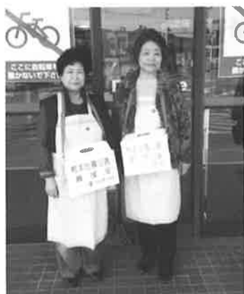
災害時には義援金の呼びかけを行っています。