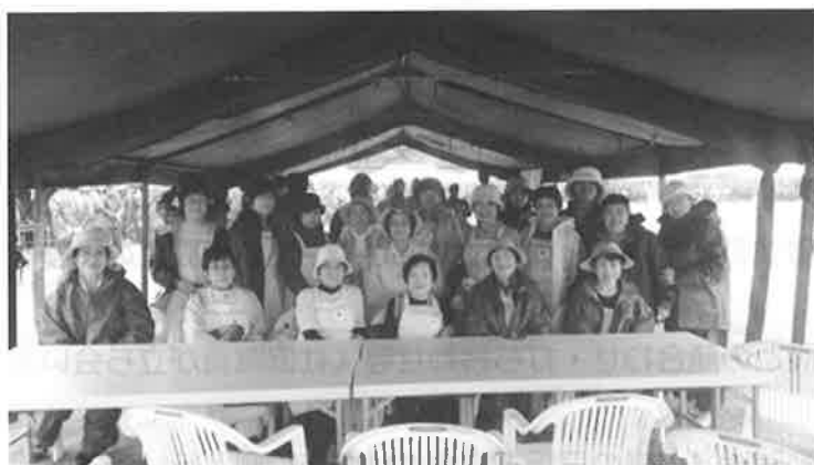
恵庭市総合防災訓練に参加。 災害時には炊き出し支援などの活動を行います。