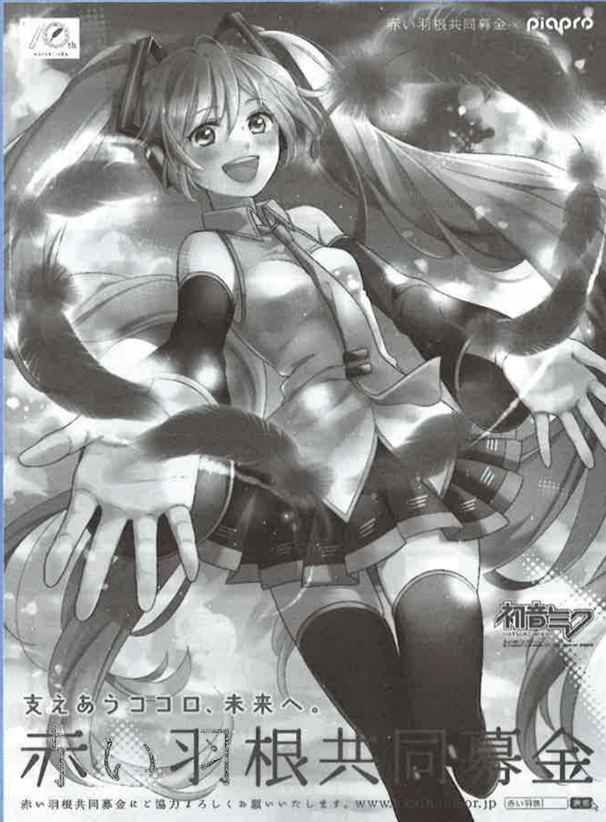
Illustration by さきっこ ©Cryation Future Media,INC.www.piapro.net piapro